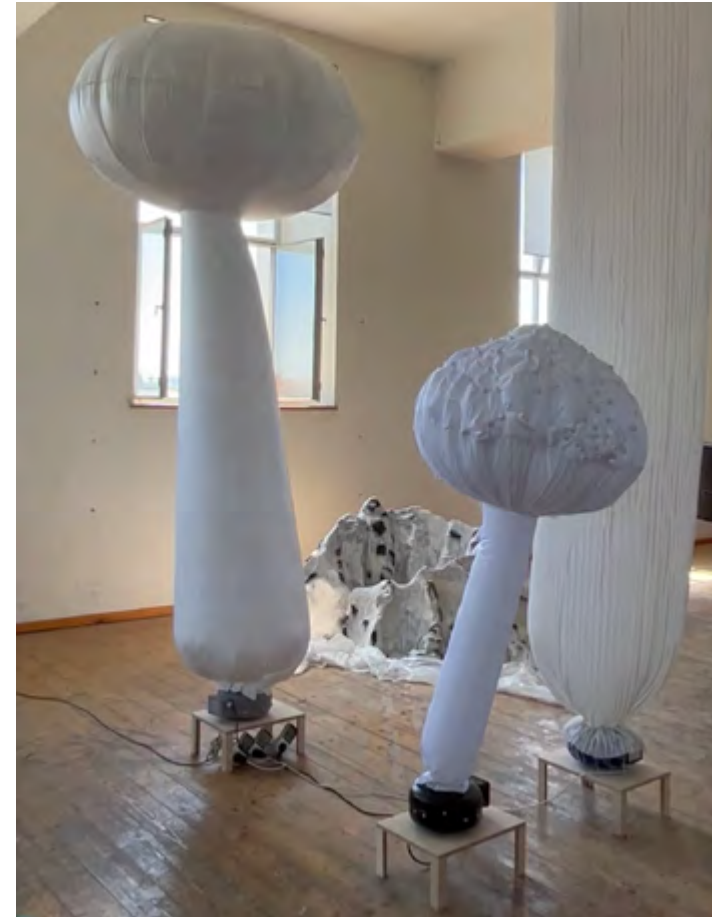
↗ Jahresausstellung des Studiengangs Bühnenbild und -kostüm an der Akade- mie der Bildenden Künste München